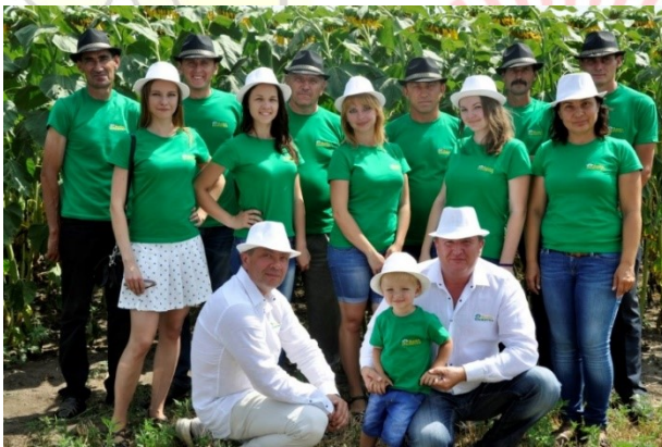
Колектив ПСП «Деметра»

У 2013 році компанія займає перше місце в Україні за врожайністю соняшника сорту Санфлора – 51 ц / га.