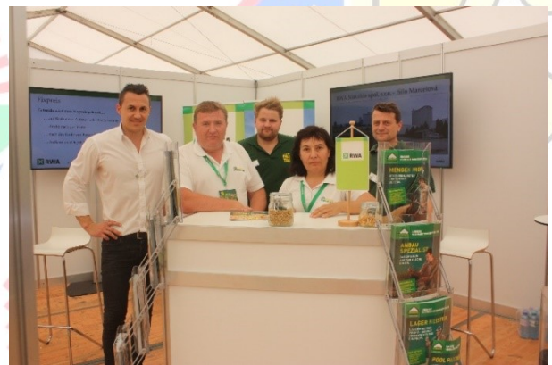
Участь у виставці в Відні

Приватне підприємство «Сіґма» є одним із визнаних лідерів аграрного бізнесу в Україні, відоме як провідний виробник м'ясних порід свиней, займається розведенням племінного молодняку. Має власний комбикормовий завод. Свою продукцію експортує в Гонконг. На підприємстві працює 107 робітників.